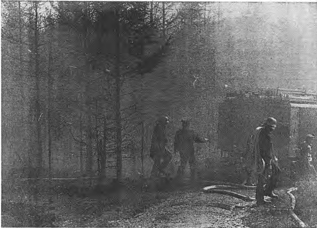
Schweißtreibende Arbeit für die 130 Feuerwehrmänner: Durch den beißenden Qualm mußten sie kilometerlange Wasserschläuche ziehen.