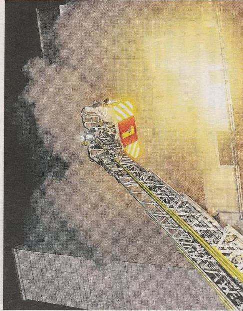
Die Feuerwehr rettete mit Drehleitern 35 Bewohner aus dem brennenden Haus. Sie hatten teilweise auf ihren Balkonen gestanden und um Hilfe gerufen.

Fakt ist: Bis auf weiteres ist das Haus nicht bewohnbar. Das Feuer war zwar schnell gelöscht, aber der starke Qualm hat im Gebäude seine Spuren hinterlassen. Die meisten Bewohner kamen bei Verwandten und Bekannten unter. Zum Gesundheitszustand des besonders schwer verletzten Kindes und seiner Mutter gab es gestern keine neuen Angaben.