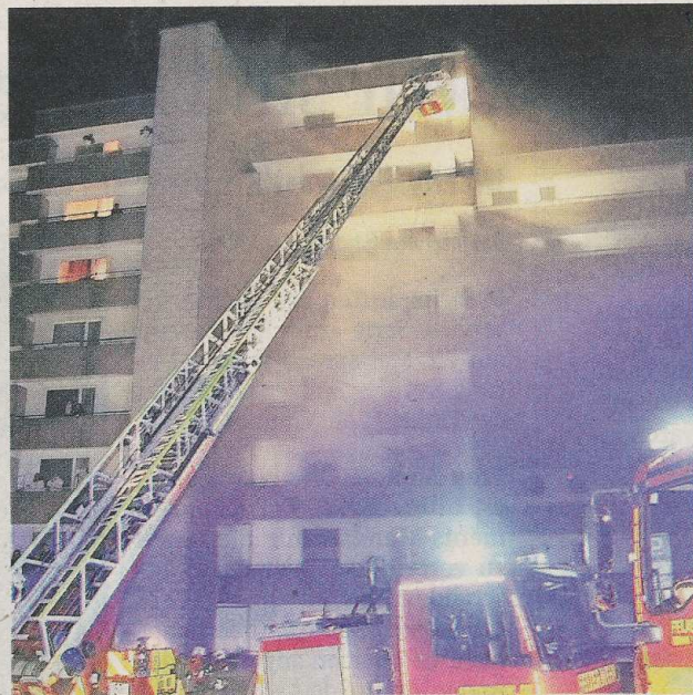
Mit einem Leiterwagen mussten die Bewohner der Wohnungen in den höheren Stockwerken gerettet werden.